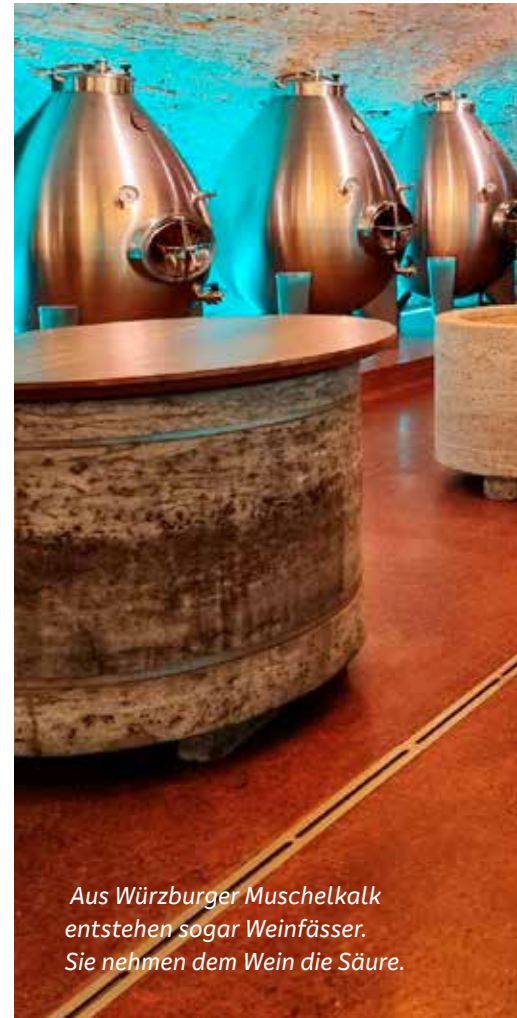
Aus Würzburger Muschelkalk entstehen sogar Weinfässer. Sie nehmen dem Wein die Säure.